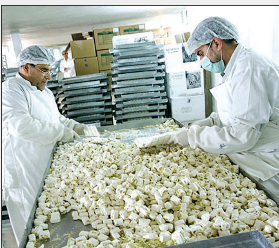
مسوولان تولید و توزیع گز و شیرینی استان خبر دادند: