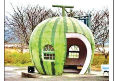
مدتهاست احساس می کنم که از دیدن ایستگاههای اتوبوس خوشی به من دست نمی دهد. جایی با نشیمنگاههای سخت و گاه خیس یا گاهی از اوقات بدون سقف و در حالی که باران بر سر انسان فرود می آید یا آفتابی که انسان را اذیت می کند. این تصاویر زیبا متعلق به برخی ایستگاه های اتوبوس در کشورهای مختلف است.