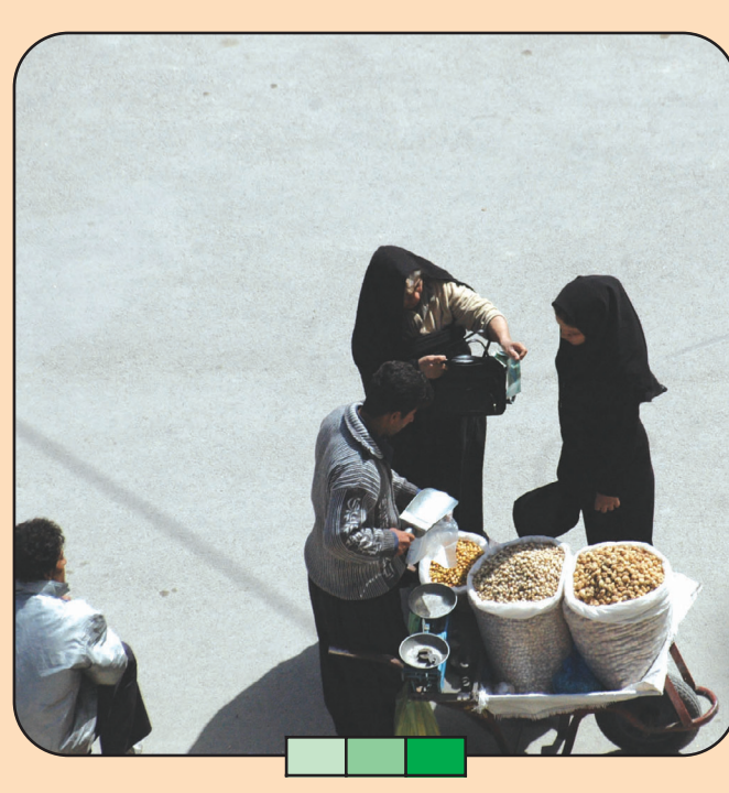
تنقلات فروشی بسیار