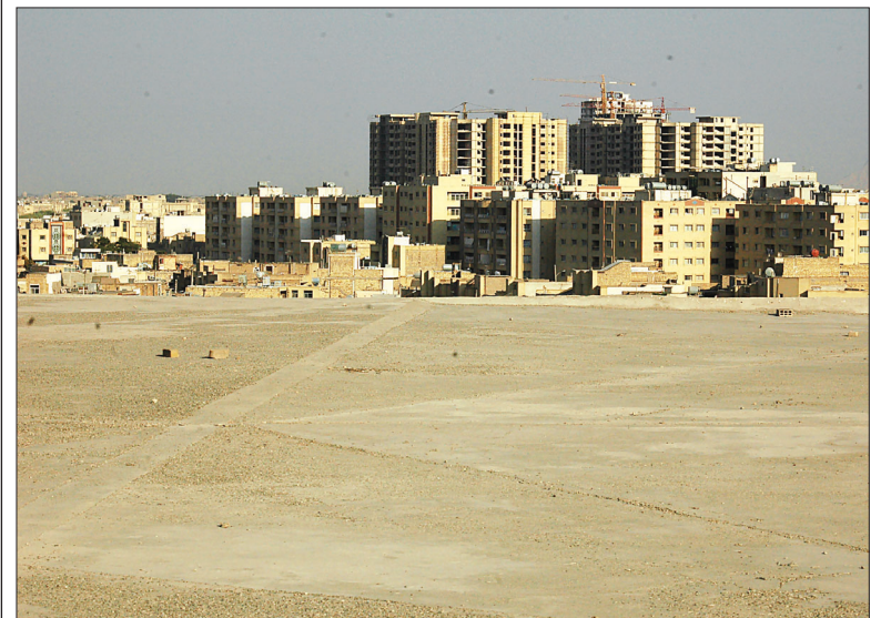
رئیس شورای اسلامی شهر اصفهان:

با کاهش قیمت زمین بستر سرمایه گذاری در مسکن فراهم شده است