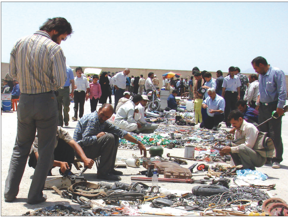
دیدن اجناس دستفروشان، ولو از سر کنجکاوی، به سوی آنها کشیده شده اند.

هر چند، گاهی موفق به این کار نمی شوند و با توقیف کالای خود روبه رو می شوند که جریمه و گرفتاری های ناشی از آن بخش عمده ای از فعالیت هایشان را بر باد می دهد.