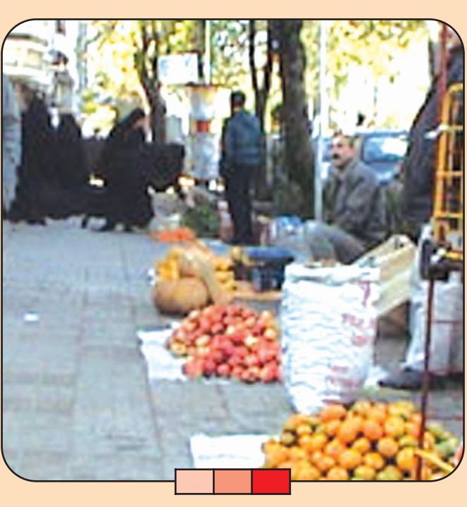
میدان میوه و تره بار در گوشه پیاده رو