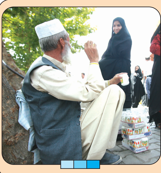
نمایی از دست فروشان میدان قیام

۹- کنترل پذیر نمودن مسیر اجرایی برنامه های شهری و هدایت آنها به نوآوری و شکوفایی پایدار و عام المنفعه.