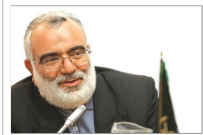
استاد اصفهان خیر داد: