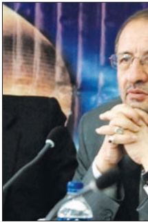
مدیرکل حفاظت محیط زیست استان در جلسه شورای اسلامی شهر اصفهان اعلام کرد:

در این مراسم اعضای شورای اسلامی شهر ورزنه تعامل و همکاری شهرداری اصفهان و کارشناسان سازمان میراث فرهنگی، گردشگری و صنایع دستی استان برای فراهم کردن امکانات و زیرساختهای لازم برای حضور گردشگران داخلی و خارجی در این منطقه را خواستار شدند که رییس شورای اسلامی شهر اصفهان قول مساعد داد تا در گفت‌وگو با مسوولان مربوطه در استان زمینه آماده سازی زیرساختهای گردشگری در شهر ورزنه را فراهم کند.