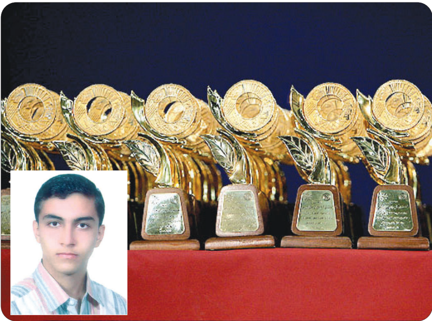
در همین زمینه