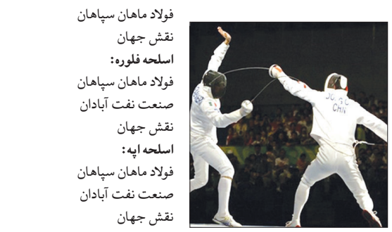
فولاد ماهان سپاهان نقش جهان اسلحه فلوره؛ فولاد ماهان سپاهان صنعت نفت آبادان نقش جهان اسلحه ایه؛ فولاد ماهان سپاهان صنعت نفت آبادان نقش جهان

تیم فولاد ماهان سپاهان در رقابت های شمشیربازی باشگاههای برتر کشور قهرمان شد. تیم فولاد ماهان سپاهان با بیشترین امتیاز به عنوان قهرمان پنجمین دوره رقابت‌های شمشیربازی باشگاههای برتر کشور دست یافت. در این مسابقات که با حضور شش تیم و در سه اسلحه و به صورت متمرکز برگزار شد؛ تیم صنعت نفت و نقش جهان نیز با ۱۳ و ۱۰ امتیاز دوم و سوم شدند.