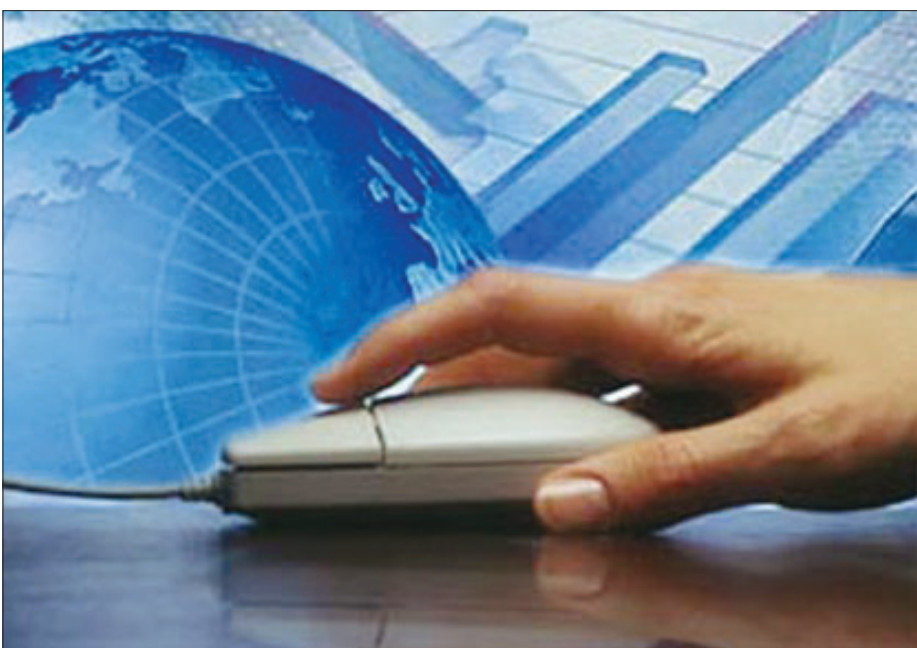
سایت اینترنتی موضوعات مختلفی را مورد نظر سنجی از بازدیدکنندگان و مراجعه کنندگان خود قرار می دهد. در این میان سایت اطلاع رسانی، cnn را می توان جزو نخستین

هستیم این است که مدیران سایت های نظرسنجی نمی توانند در هر مرحله و به دلخواه خود در نتایج نظرسنجی دستکاری کنند. با توجه به معایب ذکر شده، مبنای قرار دادن نتایج نظرسنجی های الکترونیکی و اینترنتی به منظور قضاوت در مورد نتایج کل انتخابات امکان گمراه کردن تصمیم گیرندگان را فراهم می آورد. مزایای نظرسنجی الکترونیکی نظرسنجی الکترونیکی که ممکن است از طریق شبکه اینترنت یا شبکه داخلی محل کار یا از طریق ایمیل (نامه الکترونیکی) و یا روش های دیگر صورت گیرد؛ صرف نظر از معایبی که دارد از مزایای زیادی نیز برخوردار است که در ذیل برخی از آنها آورده شده است. ۱ - در نظرسنجی الکترونیکی می توان فرم های نظرسنجی را با هزینه ای بسیار پایین و با سرعت بسیار بالا در اختیار مخاطبان در اقصی نقاط جهان قرار داده و به صورت بلادرنگ (on line) در جریان نظرات آنها قرار گرفت. ۲ - یکی از مزایای اصلی و اصول پایه هر نظرسنجی صحیح، عدم افشای نظرات پاسخگو و ارائه پاسخ های او بدون نگرانی است که در نظرسنجی الکترونیکی این امر تا حد زیادی محقق می شود. ۳ - در این نوع نظرسنجی هزینه هایی از قبیل استخدام پرسشگر، نقل و مکان آنان به محل های پرسشگری، ارسال و جمع آوری پرسشنامه و بسیاری از هزینه های دیگر حذف می شود. ۴ - استخراج آمار نظرسنجی به راحتی و به صورت بلادرنگ توسط مدیران سایت نظرسنجی امکان پذیر است و آنان قادر خواهند بود در هر لحظه آمار استخراج شده را تجزیه و تحلیل و آنالیز کنند. بدین ترتیب امکان مطالعات مقدماتی برای طراحی و اجرای فرم های نظرسنجی نهایی با هزینه ای اندک فراهم می شود. ۵ - ده ها هزار نفر به طور همزمان می توانند در نظرسنجی الکترونیکی شرکت کنند و به سرعت می توان نتیجه نظرسنجی را استخراج کرد.