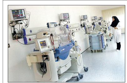
دانشگاه علوم پزشکی اصفهان اعلام کرد: