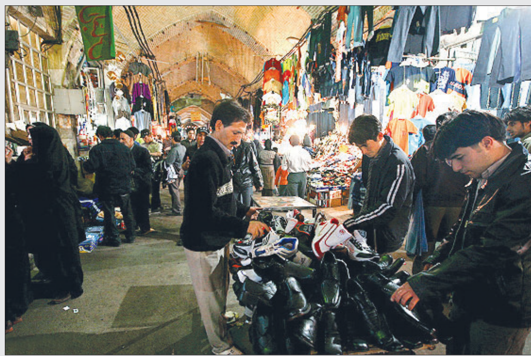
گزارش اصفهان زیبا از وضعیت بازار