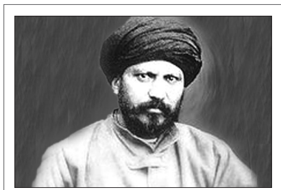
مروری بر زندگی و اندیشه‌های سیدجمال‌الدین اسدآبادی