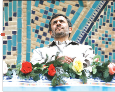
رئیس جمهور در اجتماع پرشور مردم یزد: