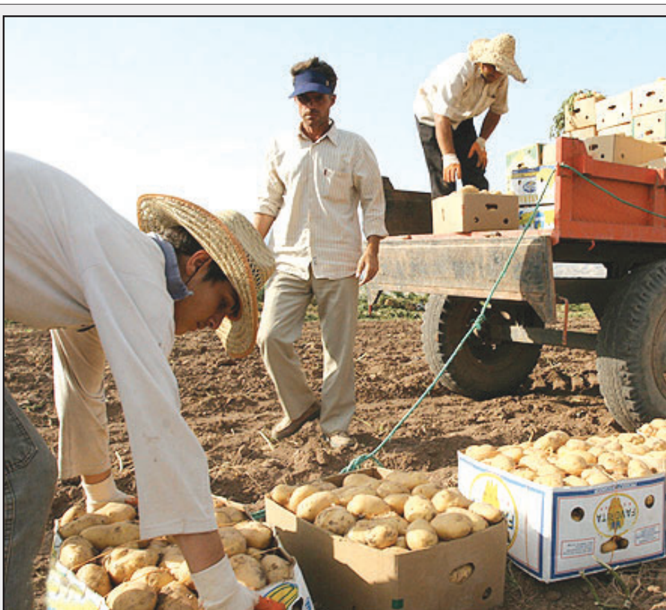
مدیر عامل سازمان تعاون روستایی استان اصفهان هشدار داد: