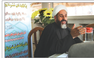
مدیر کل اوقاف و امور خیریه استان خبر داد: