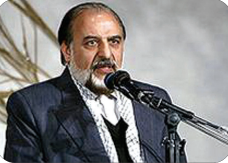
کمیته امداد کشور با بیان این که کمیته امداد در تلاش برای ایجاد اشتغال پایدار و خودکفایی مددجویان خود است گفت: اشتغال یکی از فعالیت های عمده کمیته امداد است که در دو دهه اخیر به آن پرداخته شده است؛ ضمن آن که صندوق وام خود اشتغالی کمیته امداد در سطح کشور تحقق یافته است. انواری توانمند کردن مددجویان و ایجاد اشتغال برای آنان و ارائه برنامه های آموزشی برای خوداشتغالی از اهداف مهم این نهاد برشمرد و گفت: مددجویان کمیته امداد امام خمینی (ره) استعداد های زیادی دارند که با ارائه راهکارهای مناسب و ایجاد خودباوری در آنان باید آنان را توانمند کرد انواری اظهار داشت : کمیته امداد امام

کمیته امداد کدام استان ها هستند گفت: واژه استان محروم و استان برخوردار را به کار نمی برم چرا که گاهی استان ها دارای توانمندی های بسیاری و گاهی در همان استان برخی نقاط دارای محرومیت است .