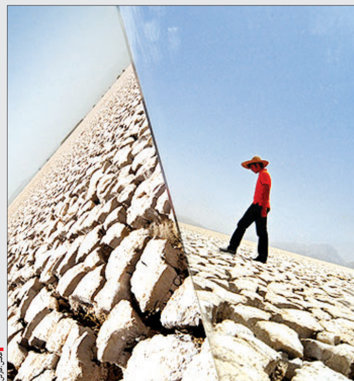
در صورت عدم بارندگی جیره بندی آب در کلان‌شهرها صورت می‌گیرد: