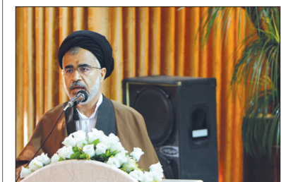
مدیرکل بازرسی استان در جمع بازرسان شهرداری اصفهان: