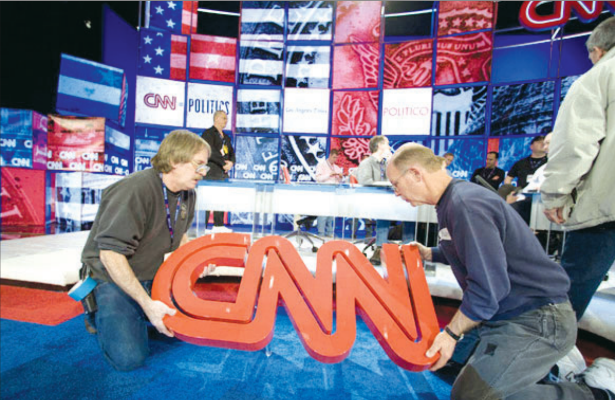
در همین زمینه

معاون تشکل های مردمی ستاد احیا امر به معروف و نهی از منکر شهرستان اصفهان بیان داشت: ترکیب این شوراها به نحوی است که بتواند در فضایی صمیمی و مردمی در راستای اشاعه معروفات حرکت کرده و از نیروی بالقوه مردم در تمام محل ها در این زمینه بهره کافی را