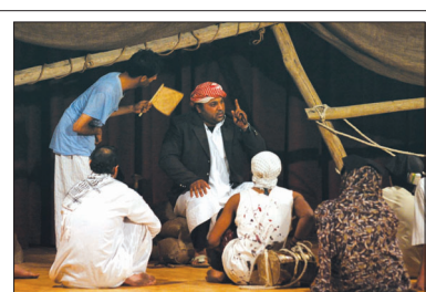
در تالار هنر به روی صحنه می‌رود