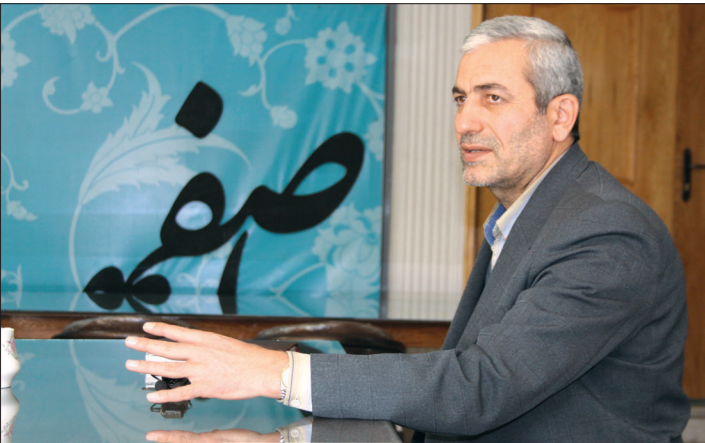
گروه‌خبر: شهرداری‌ها با ارائه ۲۰۰نوع خدمات گوناگون

در حوزه‌های عمرانی، شهرداری و خدمات شهری ارتباط تنگاتنگی با مردم دارند لذا نظارت و بازرسی در زمینه فعالیت‌های این ارگان نقش مهمی را در جهت جلب اعتماد مردم ایفا می‌کند.