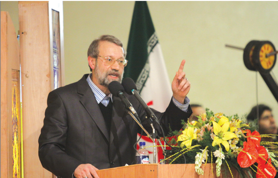
در همین زمینه

رییس مجلس از چهره‌های ماندگار اصفهان تجلیل کرد