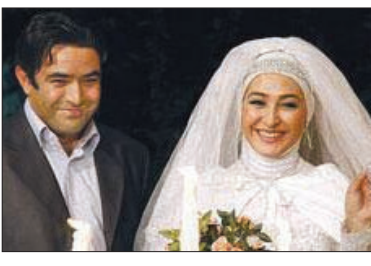
برنامه سیمای اصفهان

کنند. ۴- اگر آنچه را از آنها خواسته‌اید بدون پاسخ بگذارند سریعاً آنها را تنبیه کنید. مثلاً به گوشه‌ای برده و تا عذر خواهی نکرده‌اند به آنها اجازه حرکت ندهید. ۵- اگر حاضر نشدند اسباب بازی خود را با دیگری شریک شوند، اسباب بازی را از آنها بگیرید. ۶- هر آنچه را می‌خواهند برای آنها نخرید، تا از روی استحقاق و شایستگی بدست آورند. ۷- اگر اتاق خود را به هم می‌ریزند به آنها اجازه خروج ندهید تا زمانی که اتاق را کاملاً مرتب کنند. ۸- ساعت خواب را به آنها تحمیل کنید و بر سر حرف خود بایستید و مقاومت کنید. ۹- در مقابل کارهای درستی که انجام می‌دهند آنها را تشویق کنید.