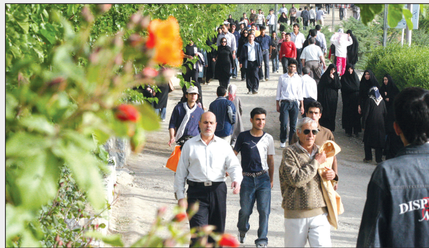
مسوولان شهری اصفهان اعلام کردند: