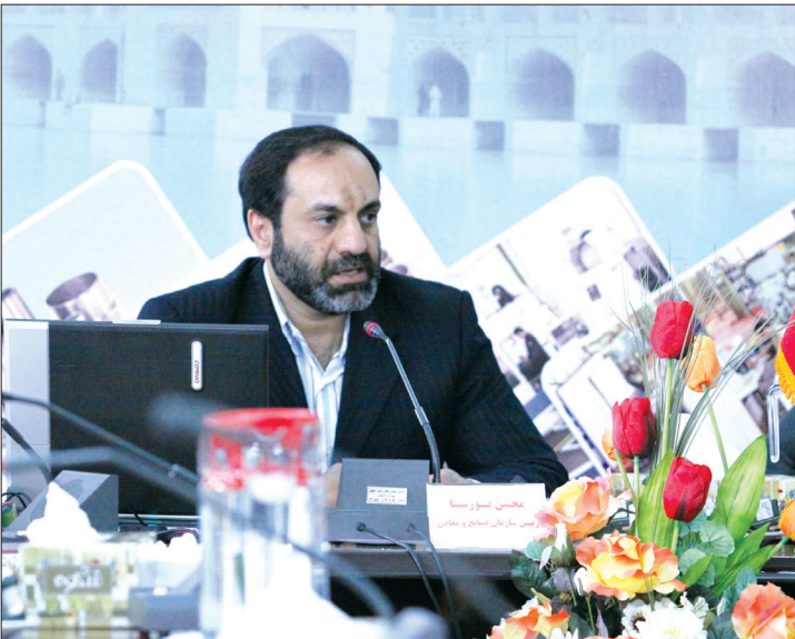
وی افزود: این مزیت در فاصله‌ی سال‌های ۷۸ تا ۸۲

فرمود: این مزیت در فاصله‌ی سال‌های ۷۸ تا ۸۲ ظاهر شده بود اما رویکرد کنونی وزارت صنایع و معادن شناسایی مزیت‌های نسبی هر استان از نظر وجود نیروهای انسانی، سابقه‌ی صنعتی و ظرفیت‌های سرمایه‌گذاری است.