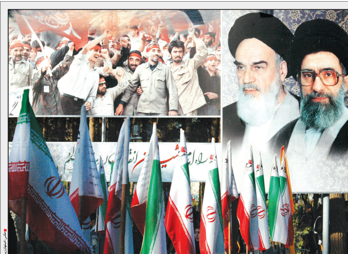
تنفس در هوای بهشتی ترین مکان نصف جهان

گروه خبر: نایب‌رئیس شورای اسلامی شهر اصفهان گفت: اعضای شورای اسلامی شهر اصفهان همزمان با ایام الله دهه فجر و با هدف حمایت از مردم و کاهش بخشی از هزینه‌های ساخت‌وساز شهروندان تصمیم گرفت تا پایان اسفندماه سال جاری به تمامی مراجعان و متقاضیان ساخت‌وساز تا سقف ده درصد تخفیف ارایه دهد.