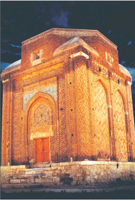
آرامگاه سید اله‌آباد