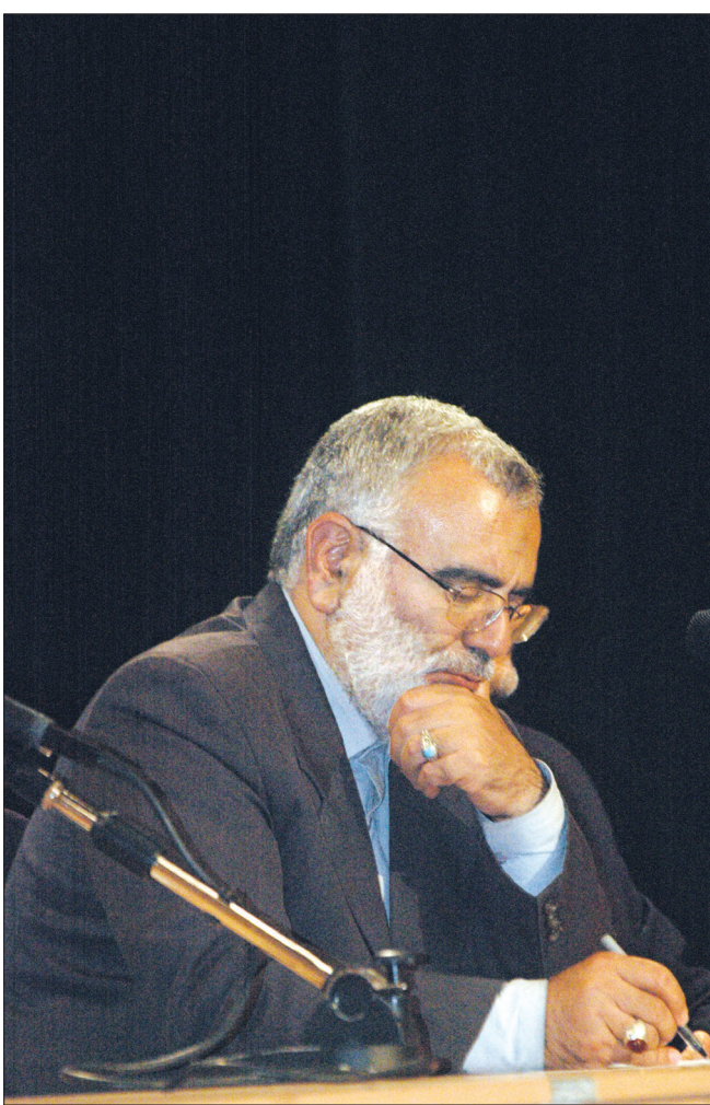
سید مرتضی بختیاری استاندار اصفهان در دیدار با جمعی از اعضای شوراهای اسلامی شهرها و دهیاران نطنز، در جریان سفر به این شهرستان.

ضمن اینکه مداحان هم می‌توانند با روایت صحیح واقعه عاشورا در بین مردم تاثیرگذار باشند.