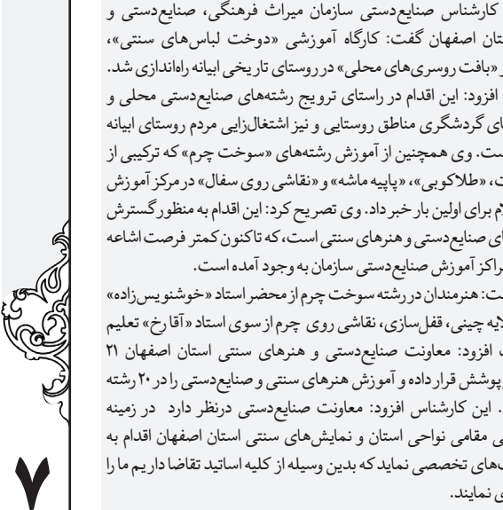
برگزاری کارگاه آموزشی برای زنان روستاییان اصفهان در محل مدرسه دخترانه روستای کاشان.

ارتباط با سرویس خبر shahrestan@isfahanziba.ir ۳۳۱ داخلی ۸-۶۶۲۹۹۳۵