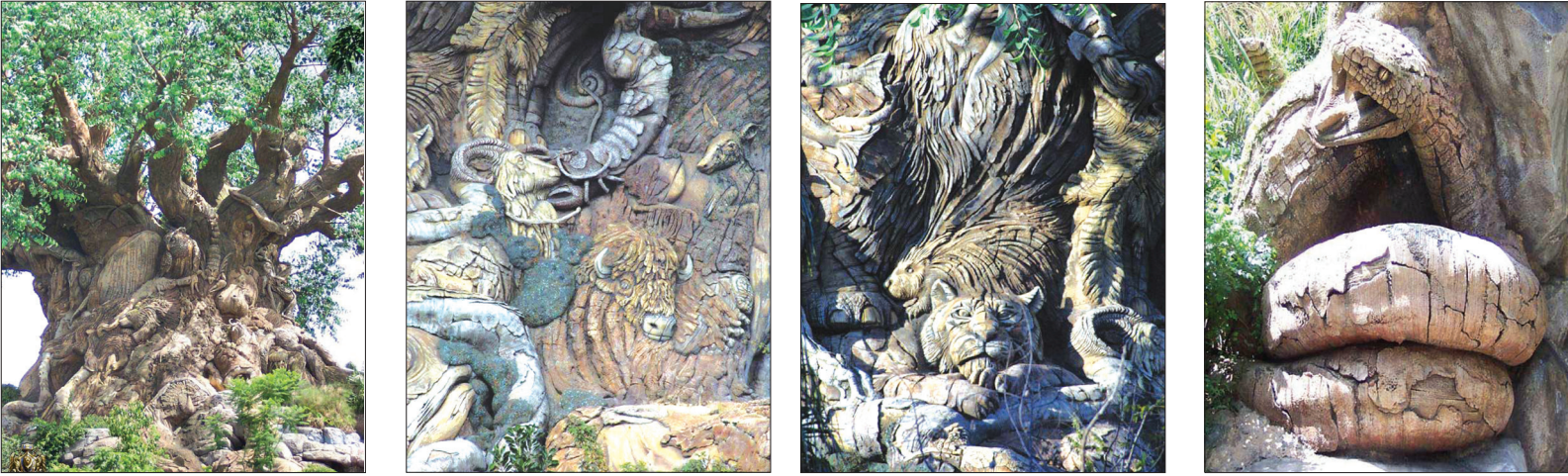
این تصاویر مربوط به درختی در پارگی در فلوریدا می باشد، هنرمندان بسیاری روی این درخت کار کردند تا شکل نزدیک ۴۰۰ حیوان را روی آن درست کنند