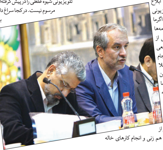
برنامه‌های تلویزیونی کارشان شده دو به هم زنی و انجام کارهای خاله