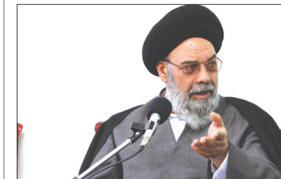
امام جمعه اصفهان در دیدار با استاد فرشچیان عنوان کرد:

گروه شهرستان ها: امسال به جای انار اردستان و شهرضا، با محصول افغانستان شب یلدا را جشن گرفتیم، دیگ های محرم را با برنج دانه بلند پاکستانی و لپه چین پر کردیم، گوجه ترک سالاد سفره های اصفهانی را تزیین کرد. نان سفید و خوشبخت از سفرها پرکشید و نان سیاه با گندم وارداتی جانشین آن شد. خشکیار خوانسار به رویا پیوست و سبزی صیفی شهرستان های استان نایاب گردید. قیمت هلوی قلعه شاه، زردآلو و انگور خوانسار صدرنشین میوه های تابستانی شد. و ما آموختیم که به غیر پرتغال و سیب مصری می توان از سایر محصولات کشاورزی و وارداتی هم استفاده کرد. دستان خشکسالی اطراف حلقوم ما حلقه شده و روز به روز بر میزان فشارش افزوده می شود. می توان صبر کرد و از شدت خفگی کیود شد و می توان با آن جنگید. دو ماه قبل که با مسوولان اداره کل هواشناسی اصفهان سخن گفتیم، از جدال بارندگی نتیجه گرفتند که سال نرمالی را پیش رو خواهیم داشت. آن زمان بارش های انجام شده، فراتر از میزان نرمال بود که نوید کشت پاییز بدون دغدغه را می داد. اما بارندگی های هفته گذشته راوی حکایت دیگری بود. صفحه ۷