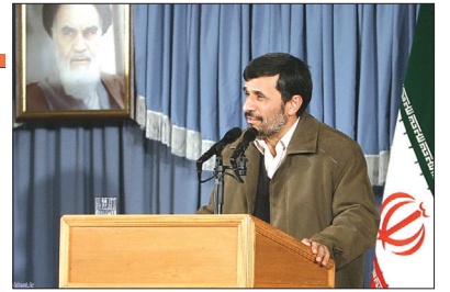
رییس جمهور در جمع معاونان و مدیران سازمان ملی جوانان: