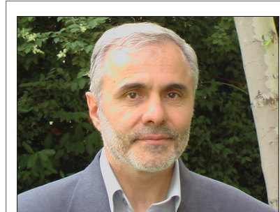
عضو کمیسیون فرهنگی شورای اسلامی شهر خبر داد:

گفتنی است این جلسه با حضور مدیر کل امور اجتماعی و شوراهای استانداری اصفهان، معاون فرهنگی و پژوهشی اداره کل تبلیغات اسلامی استان، دبیر انجمن جامعه استان اصفهان، مسوول روابط عمومی مرکز رسیدگی به امور مساجد، مدیر آموزش و پژوهش صدا و سیما و نماینده گروه مشاوران جوان استانداری اصفهان در اداره کل فرهنگ و ارشاد اسلامی استان اصفهان برگزار شد.