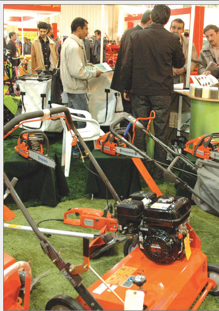
معاون کمک های تجاری سازمان توسعه و تجارت ایران عنوان کرد: