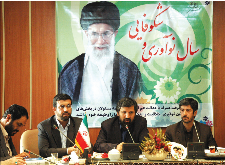
حضور ۱۴ استان در این جشنواره