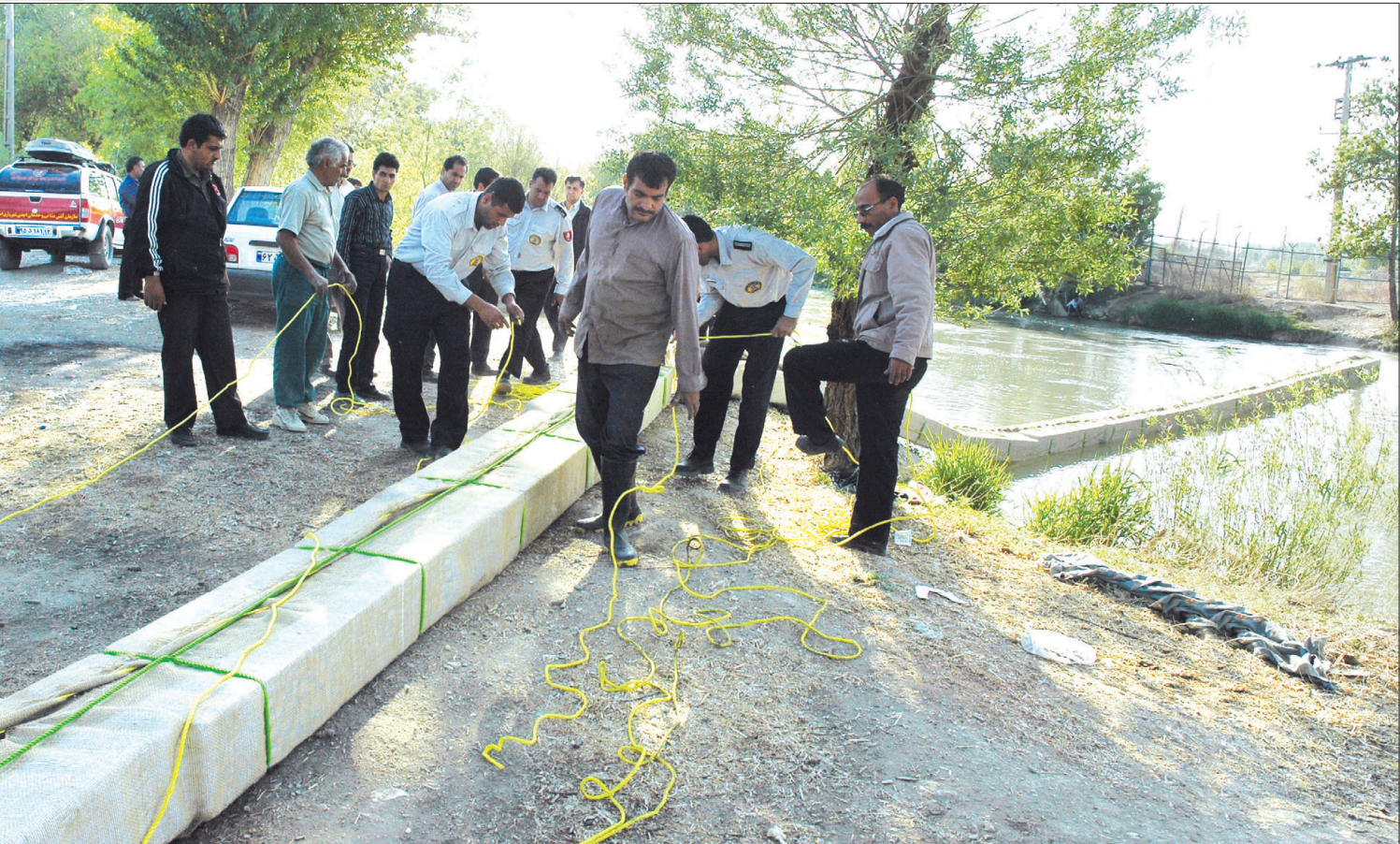
عملیات پیش‌نگاره هم‌سازان سازمان آبرسانی و خدمات شهری اصفهان برای جلوگیری از ورود آلودگی به شهر - ۲۸ فروردین ۱۳۸۷

این حادثه فشار آب اصفهان، فلاورجان، خمینی‌شهر، برخوار و میمه، نجف‌آباد و ناین را تحت تاثیر قرار داده است. تا زمان فعال شدن تصفیه‌خانه باباشیخ‌علی آب چاه‌های فلن به طور کامل وارد شبکه شده که کاملاً آشامیدنی و بهداشتی است. مردم تنها با صرفه‌جویی در ۲۴ ساعت آینده می‌توانند به بازگشت به کار تصفیه‌خانه کمک کنند.