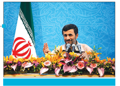
رئیس جمهور تشریح کرد: