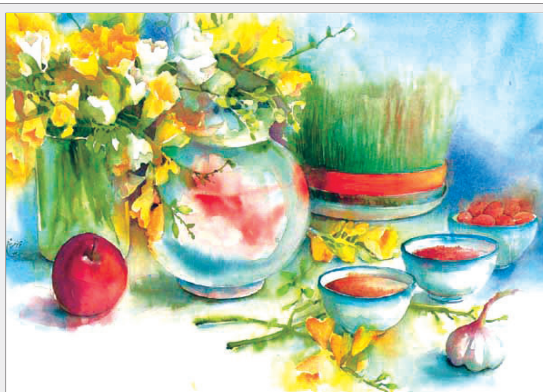
اصفهان زیبا کارکردهای فرهنگی و اخلاقی نوروز را بررسی می‌کند: