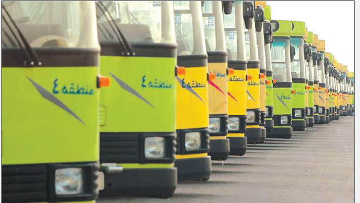
ناچار باید فکری برای بودجه اتوبوسرانی

کلان‌شهر اصفهان بکنیم. در ادامه رییس شورای اسلامی شهر اصفهان نیز با تأیید سخنان شهردار گفت: فعلاً در انتظار عمل به وعده‌ها هستیم اما عملی نشدن قول‌ها، اردیبهشت‌ماه آینده آخرین تصمیم برای افزایش بلیط اتوبوس را اتخاذ خواهیم نمود.