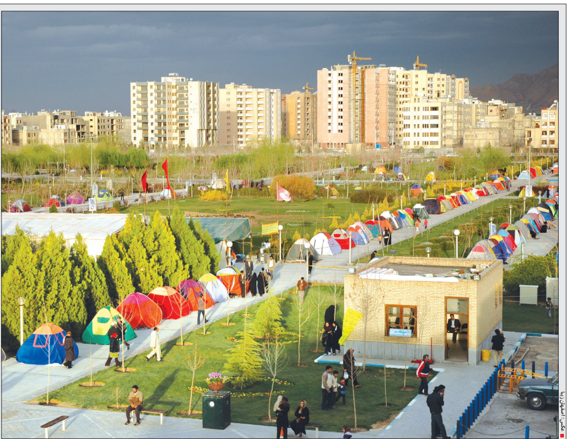
با همکاری ۴۲ دستگاه استانی

شورای اسلامی شهر اصفهان با واگذاری عملیات اجرایی زیرگذر خیابان بزرگمهر حد فاصل خیابان هشت‌بهشت و تقاطع نورباران به سازمان عمران شهرداری موافقت کرد. اعضای شورای اسلامی شهر اصفهان با پیشنهاد واگذاری عملیات اجرایی زیرگذر خیابان بزرگمهر حد فاصل خیابان هشت‌بهشت تا تقاطع نورباران به سازمان عمران شهرداری با برآورد اولیه ۴۵ میلیارد ریال موافقت کردند. لازم به ذکر است این پروژه عظیم در راستای تسهیل رفت و آمد در منطقه بزرگمهر و هشت‌بهشت و نورباران اجرا می‌شود. صفحه ۱۰