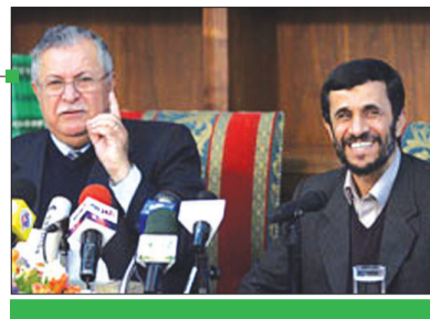
رئیس جمهور در سفر به عراق تاکید کرد: