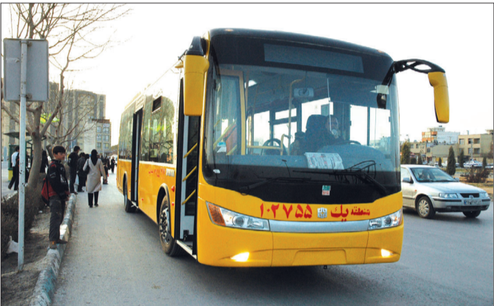
در همین زمینه

سامانه بی آر تی با خطوط ویژه اتوبوس سریع السیر شهری در اصفهان راه‌اندازی می‌شود. هم اکنون مسیر خط ویژه خیابان جی (از فلکه احمدآباد تا ترمینال همدانیان) به تصویب کمیته فنی شهرداری اصفهان رسیده و عملیات اجرایی آن قرار است از سال آینده آغاز شود.