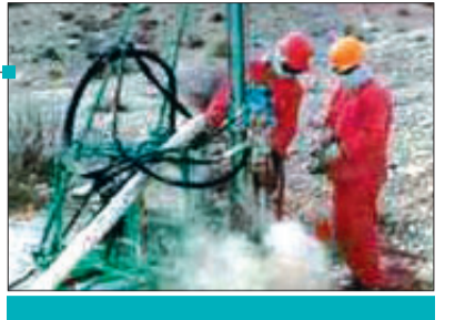
در شرایط تحریم اقتصادی

■ روزنامه صبح ایران ■ شماره سیم و پنجاهم ■ ۱۲ صفحه ■ ۵۰۰ ریال ■ یکشنبه ۷ بهمن ماه ۱۳۸۶ ■ ۱۸ محرم ۱۴۲۹ ■ ۲۷ ژانویه ۲۰۰۸