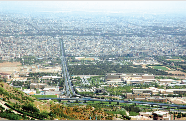
نر هشین زمینه

با آغاز دور دوم سهم‌بندی سوخت، سهمیه بنزین تاکسی‌های بنزین‌سوز ۱۰۰لیتر کاهش یافت و از ۸۰۰لیتر در ماه به ۷۰۰لیتر کاهش پیدا کرد. سهمیه بنزین و گاز واردان در ۶۰۰لیتری به ۴۰۰لیتر کاهش یافته است. ضمن آن که بر اساس تصمیمات متخذه مقرر شده بود جهت روان‌سازی سوختگیری خودروهای مذکور بیشتر جایگاه‌های عرضه گاز طبیعی با هماهنگی لازم صرفاً به سوختگیری تاکسی‌ها اختصاص یابد. با این حال مشکل