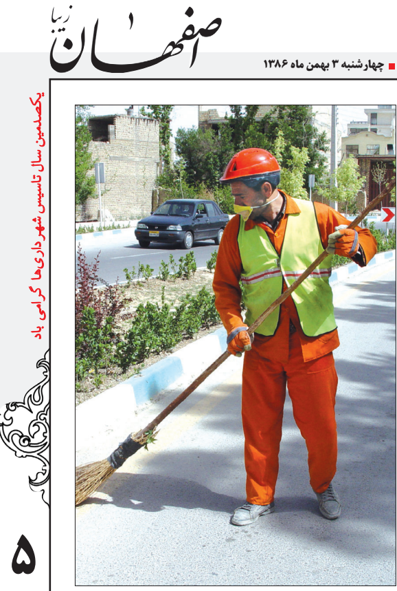
یکصدمین سال تأسیس شهرداری‌ها گرامی باد

د - پیشنهادات رسیده در ساعت ۱۰ روز بعد ب ۳/۴/۱۳۲۸ در کمیسیون مشكله با حضور نماینده انجمن شهر باز و قرائت و حائز حداقل تعیین خواهد شد. ۷- به پیشنهاداتی که دیرتر از موعد مقرر برسد یا مشروط و مبهم فاقد قبض باشند ترتیب اثر داده نمی‌شود.