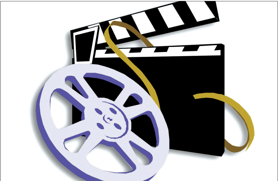
گروه سینما و تلویزیون - معصومه طاهری: