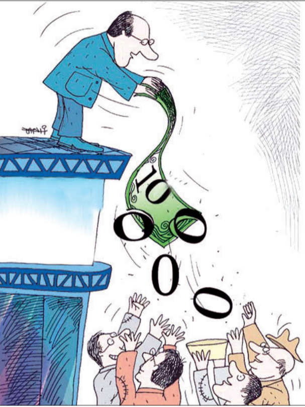
در همین زمینه

اسلامی ایران اشاره کرد و نوشت: بانک مرکزی جمهوری اسلامی ایران موظف شده تا طرح حذف سه صفر از مقابل پول ملی ایران را مورد مطالعه و بررسی کارشناسی قرار دهد. این باشک با اشاره به بررسی طرح حذف سه صفر از مقابل پول ملی ایران اعلام کرد این طرح برای جلوگیری از زیان‌های مادی و معنوی ناشی از کاهش ارزش پول ملی اتخاذ شده است.