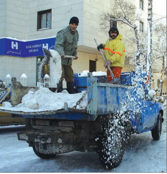
پیش‌بینی شده است.

همچنین امروز وضعیت هوای اکثر شهرستان‌های استان ابری، همراه با مه و وزش باد و یخبندان پیش‌بینی شده است.