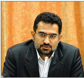
نماینده وزیر علوم:

نماینده وزیر علوم، تحقیقات و فناوری گفت: رییس جمهوری توجه ویژه به بخش پژوهش در دانشگاه‌ها دارد.