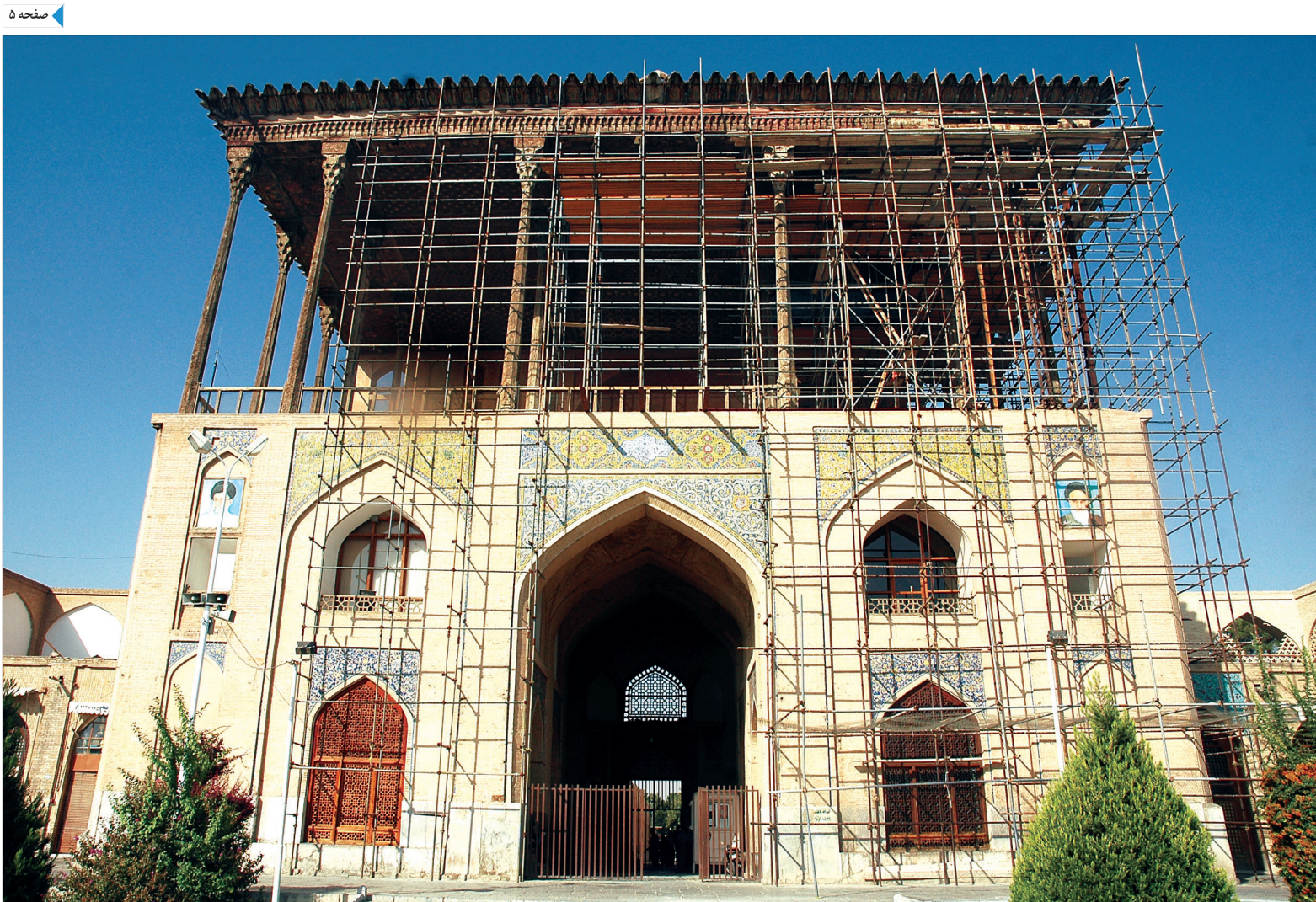
محمد بنیادگورزی - اصفهان/رنا