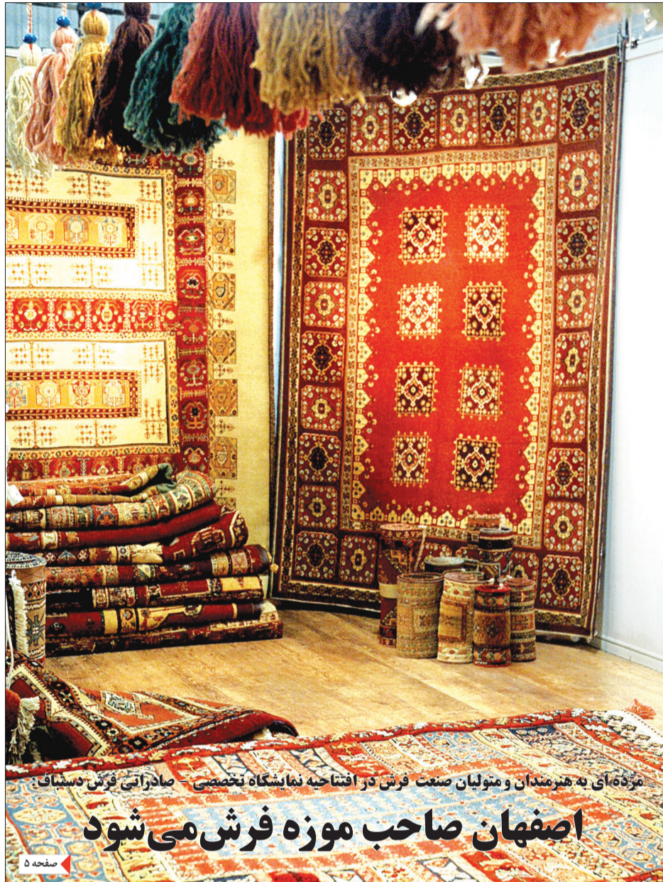
موزه‌ای به هنرمندان و متولیان صنعت فرش در افتتاحیه نمایشگاه تخصصی صادراتی فرش اصفهان صاحب موزه فرش می‌شود

شورای نامگذاری معابر شهر اصفهان با اعتقاد بر فرهنگ شهادت، تاکنون بیش از ۴۰۰ خیابان و معبر فرعی شهر اصفهان را با نام شهدای انقلاب اسلامی و دفاع مقدس مزین کرده است. علاوه بر این نصب تابلوهای شمارنگذاری به منظور تسهیل در دسترسی شهروندان اخیراً بر سر معابر تعبیه شده و هیچ مغایرتی با این نامگذاری ندارد. استفاده از شخصیت‌ها و چهره‌های شاخص به خصوص شهدا در نامگذاری اماکن و خیابان‌ها در کشور ما امری رایج و مرسوم به شمار می‌آید که دلایل آن را می‌توان در قدردانی از این چهره‌ها، الگوسازی برای نسل‌های آینده و مواردی از این دست که خود سوژه‌ی یک پژوهش جامع‌شناسانه است جست‌وجو نمود. خوشبختانه شهر اصفهان از این قاعده مستثنی نبوده و شورای نامگذاری معابر این شهر را در نظر گرفتن جوانب مختلف و ریشه‌های تاریخی، ملی، مذهبی، اجتماعی، فرهنگی و هنری جامعه و محترم شمردن باورهای مردم نامگذاری کرده، به طوری که تاکنون حدود ۴۰۰ معبر اصلی و فرعی با نام شهیدان دفاع مقدس و انقلاب اسلامی مزین شده است. علاوه بر این نامگذاری، این شورا به تازگی موارد دیگری همانند نصب تابلوهای شمارنگذاری معابر فرعی برای تسهیل در دسترسی و