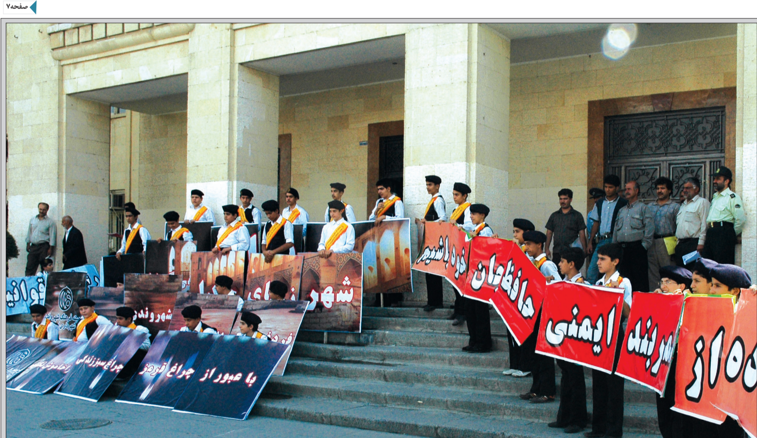
صبح دیروز در اصفهان